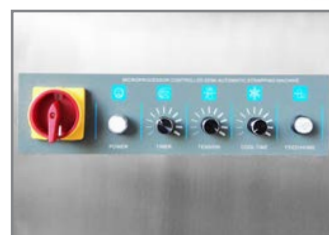
PANNELLO DI CONTROLLO CONTROL PANEL