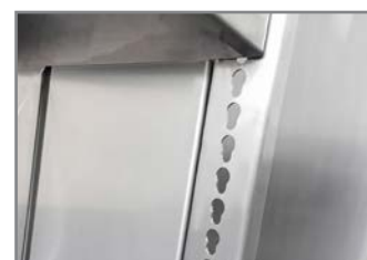
REGOLAZIONE PIANO DI LAVORO ADJUSTABLE WORKING TABLE HEIGHT