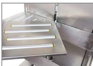
PIANO DI LAVORO A RULLI FOLLI WORKING TABLE WITH IDLE ROLLERS