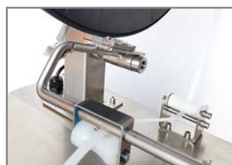
PASSAGGIO ESTERNO REGGIA EXTERNAL STRAP POSITION