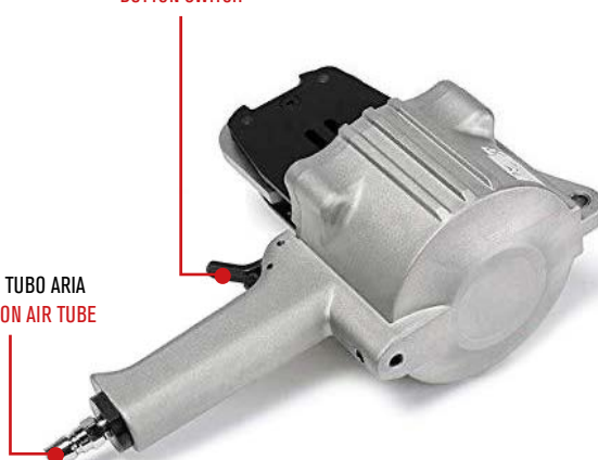
INNESTO TUBO ARIA CONNECTION AIR TUBE