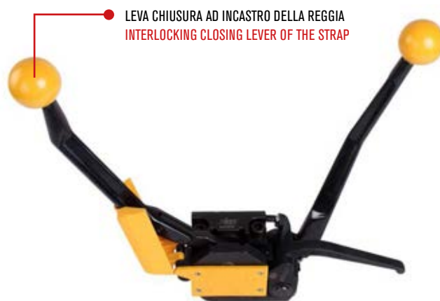
LEVA CHIUSURA AD INCASTRO DELLA REGGIA INTERLOCKING CLOSING LEVER OF THE STRAP