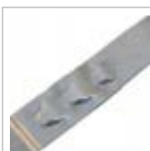
CHIUSURA AD INCASTRO INTERLOCKING CLOSURE