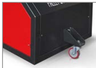
RUOTA PIVOTTANTE POSTERIORE BACK PIVOTING WHEEL