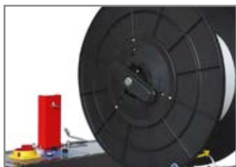
SISTEMA RAPIDO SOSTITUZIONE REGGIA EASY STRAP COIL CHANGE