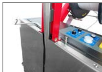
TESTA DI REGGIATURA LATERALE SIDE STRAPPING HEAD