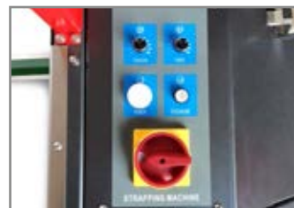
PANNELLO DI CONTROLLO CONTROL PANEL